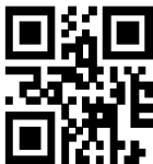
Contoh QR code